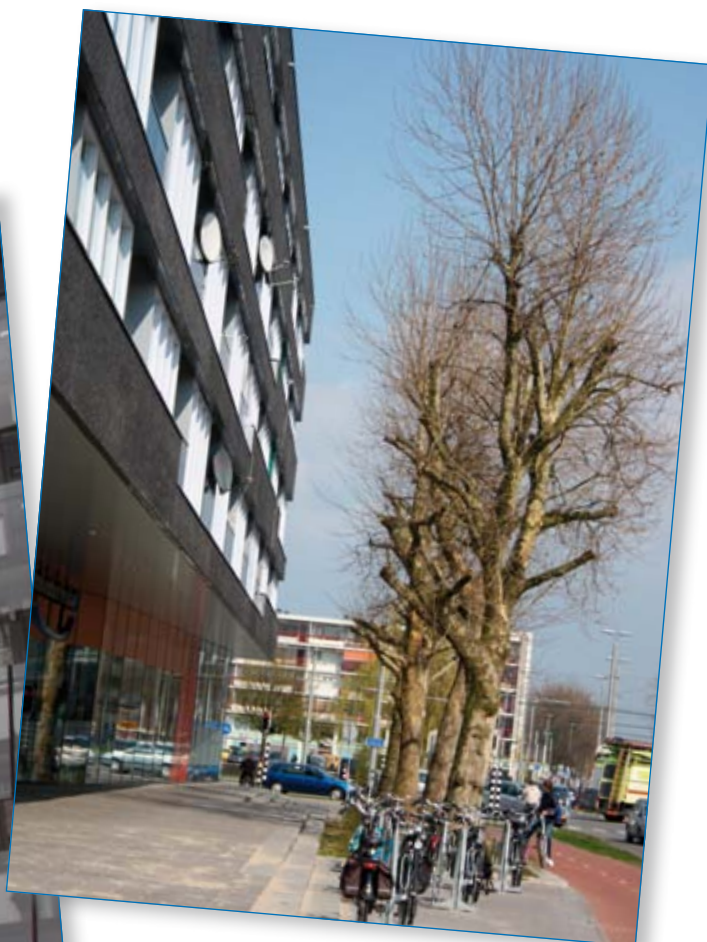
Let op: straatmeubilair