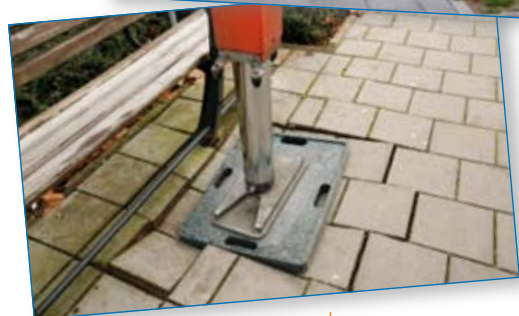
Let op: draagkracht ondergrond