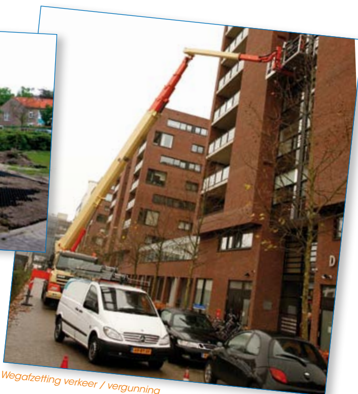
Wegafzetting verkeer / vergunning